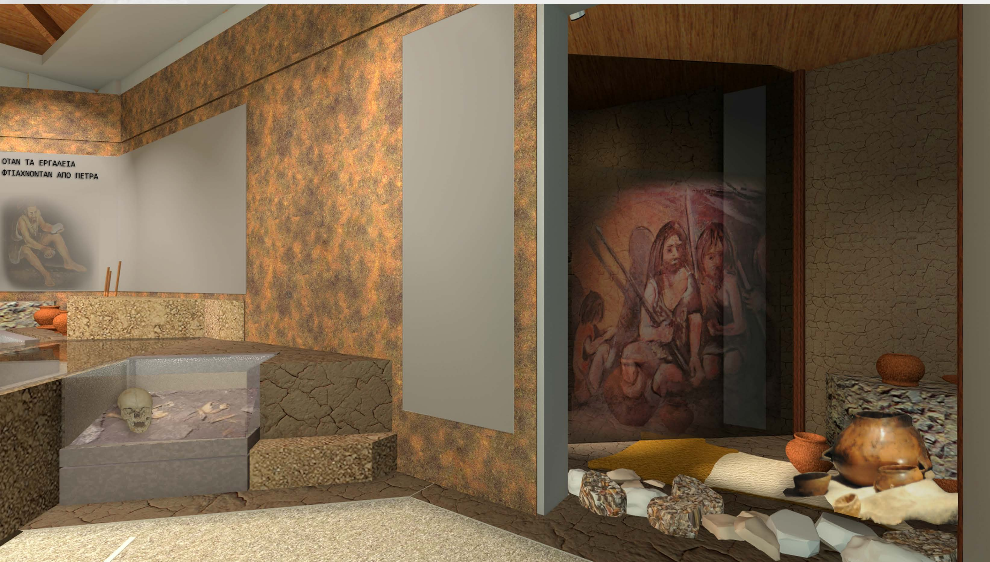
Άποψη της υποενότητας "Όταν τα εργαλεία φτιάχνονταν από πέτρα".