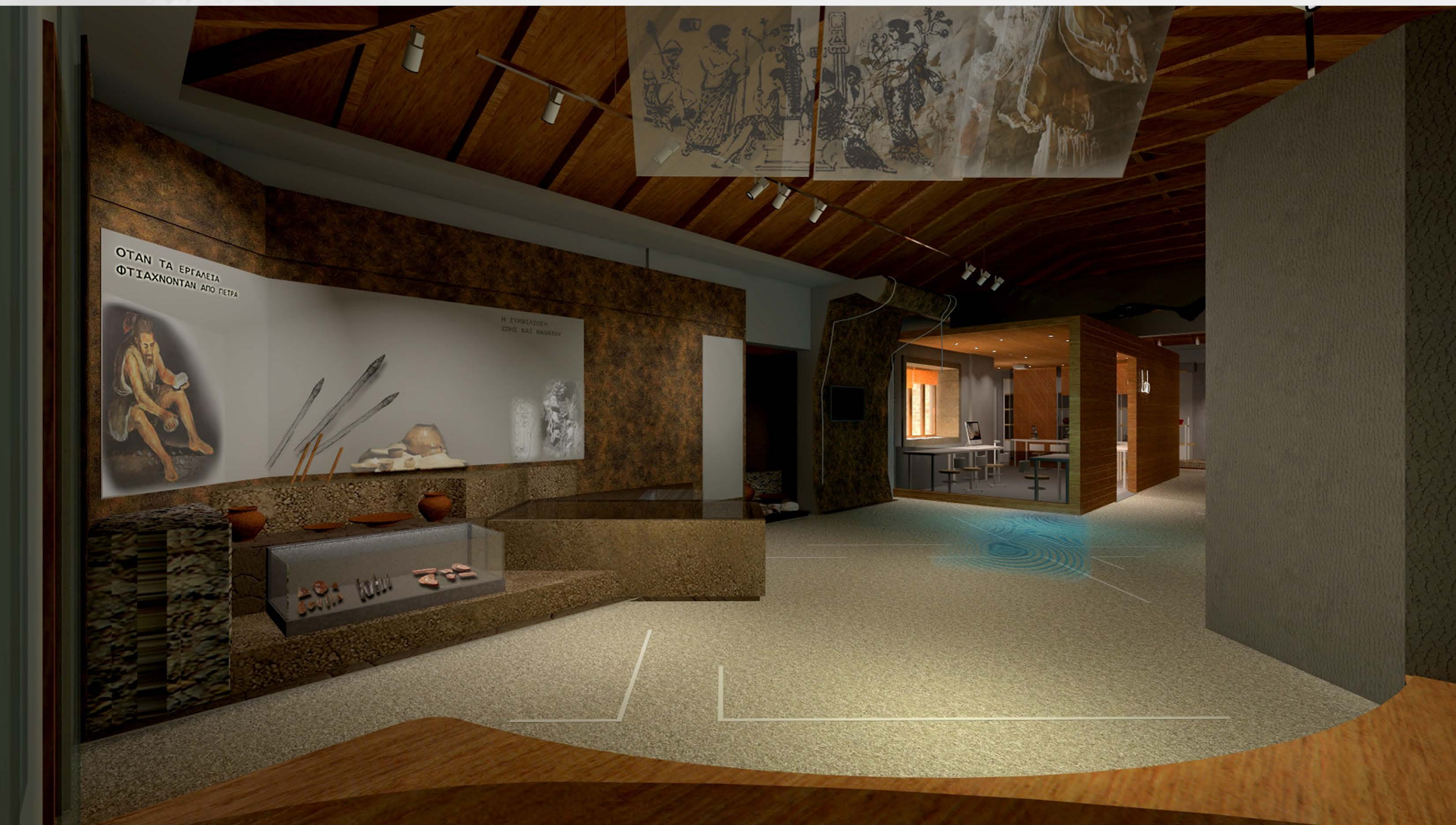
Άποψη της ενότητας "Από την επιβίωση στην εξερεύνηση" από τη θέση του αμφιθεάτρου.