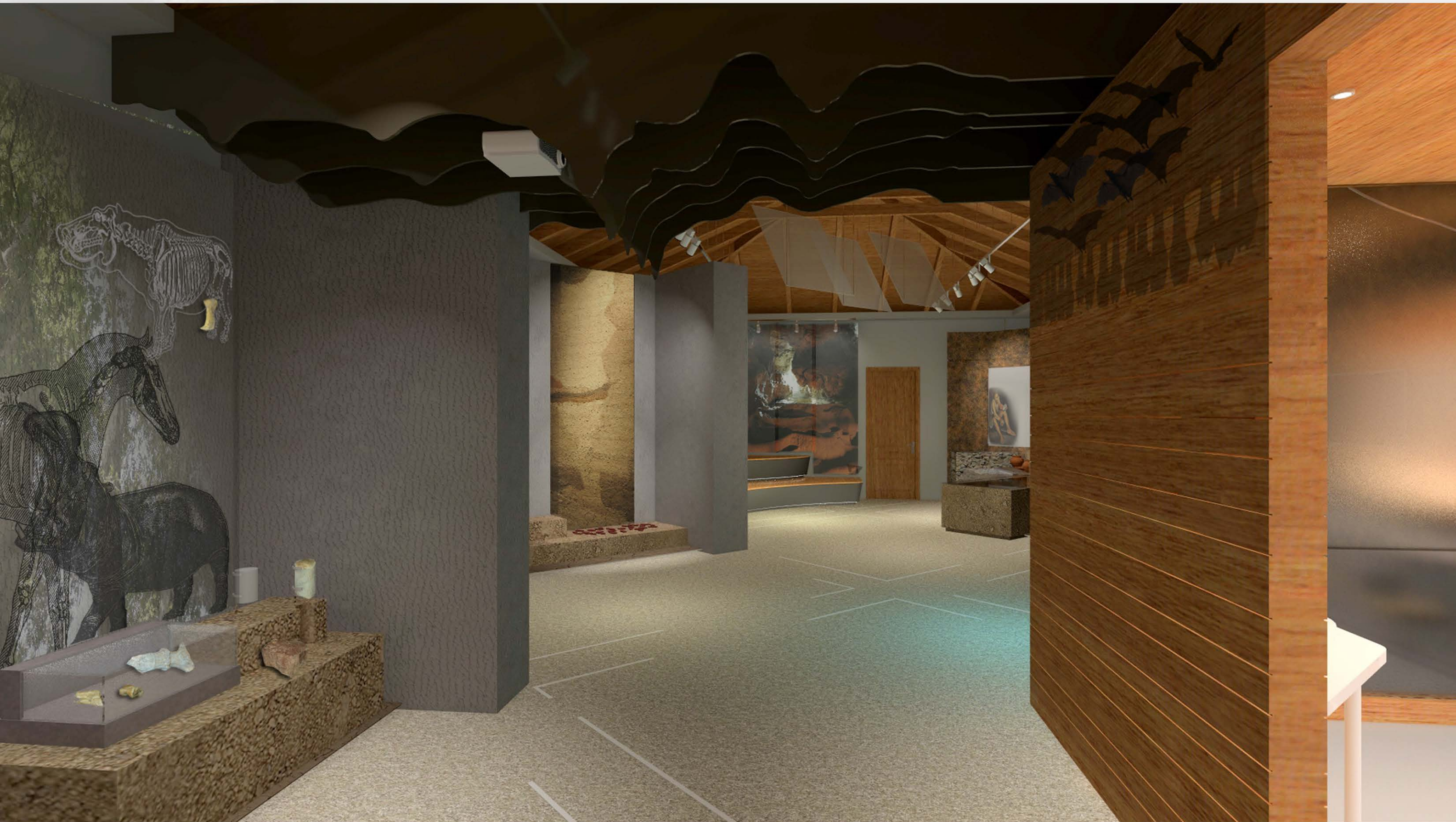
Άποψη του χώρου στη μετάβαση από την ενότητα “Δεκάδες χιλιάδες χρόνια πριν” στην ενότητα “Από την επιβίωση στην εξερεύνηση”.