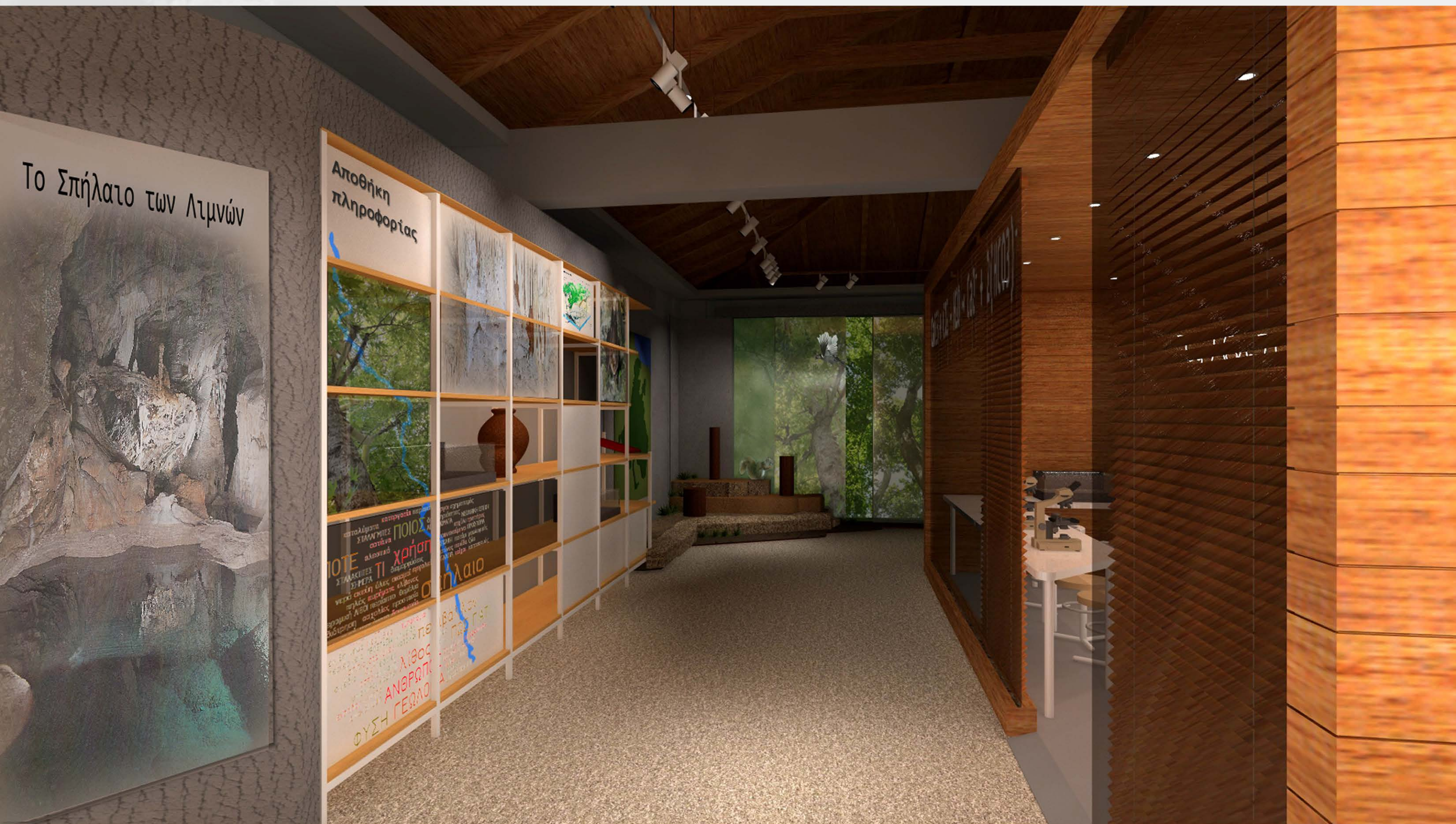
Εισαγωγική ενότητα έκθεσης. "Αποθήκη πληροφορίας".