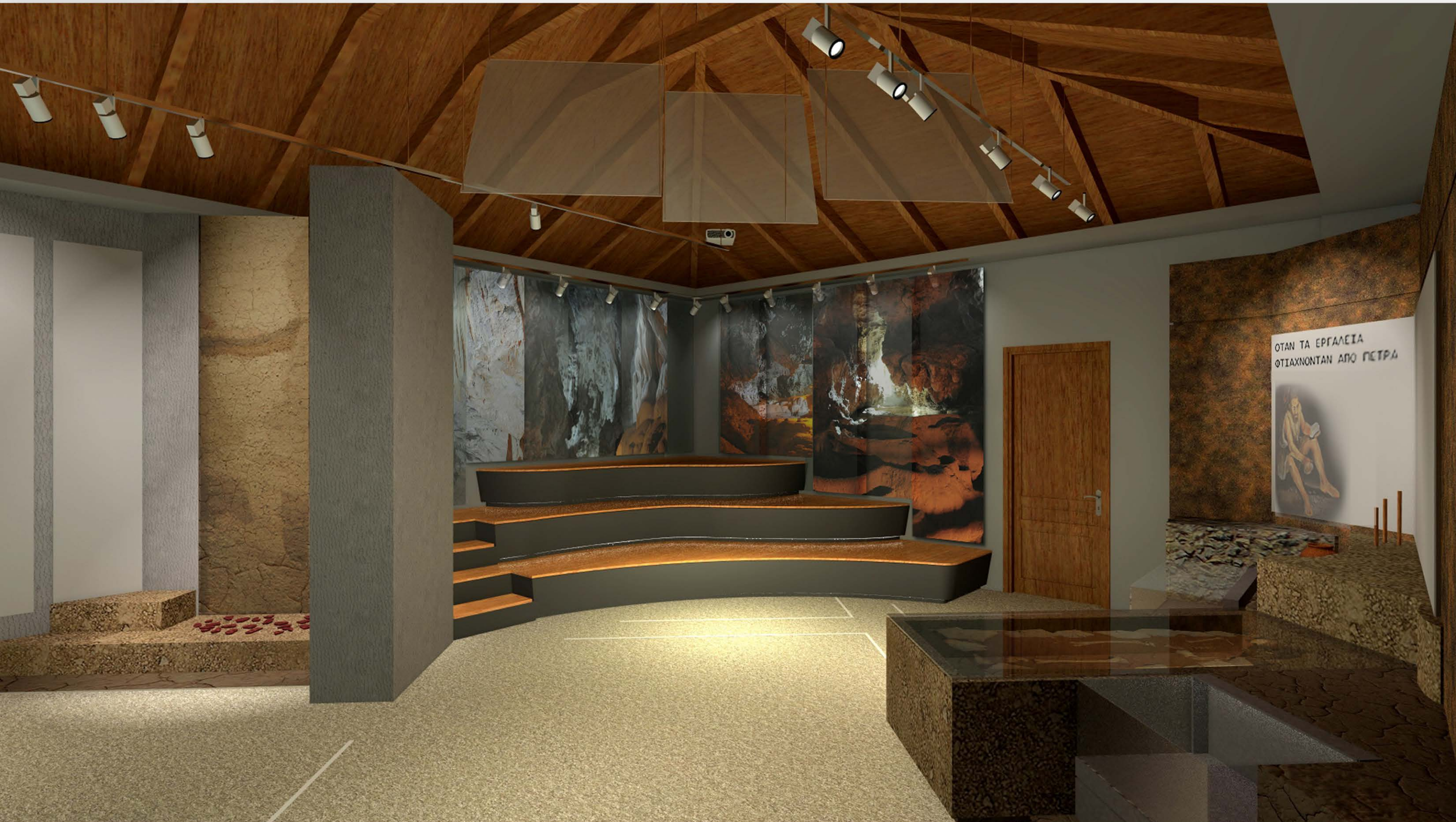
Άποψη της ενότητας "Από την επιβίωση στην εξερεύνηση" από τη θέση του αμφιθεάτρου.